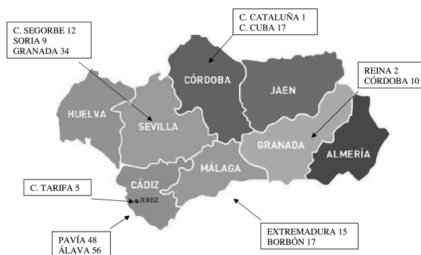
Mapa 1. Situación de los Regimientos de Infantería de la II Región Militar.

En el mapa 1 se muestra la situación de los Regimientos de Infantería de la II Región Militar.