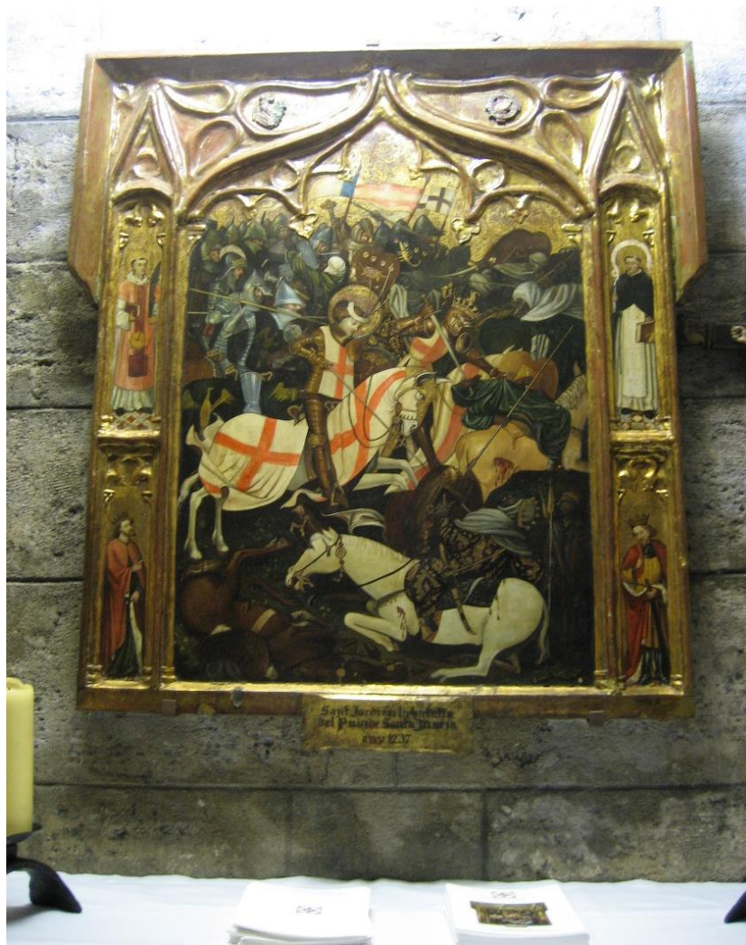
Retable de la batalla d'El Puig. Sant Jordi en l'ermita d'El Puig de Santa Maria

El 20 de decembre de 1336 el Consell Municipal de València donà un pregó instant a que tot veí armat acompanye a la Senyera per a defendre els drets de la ciutat.