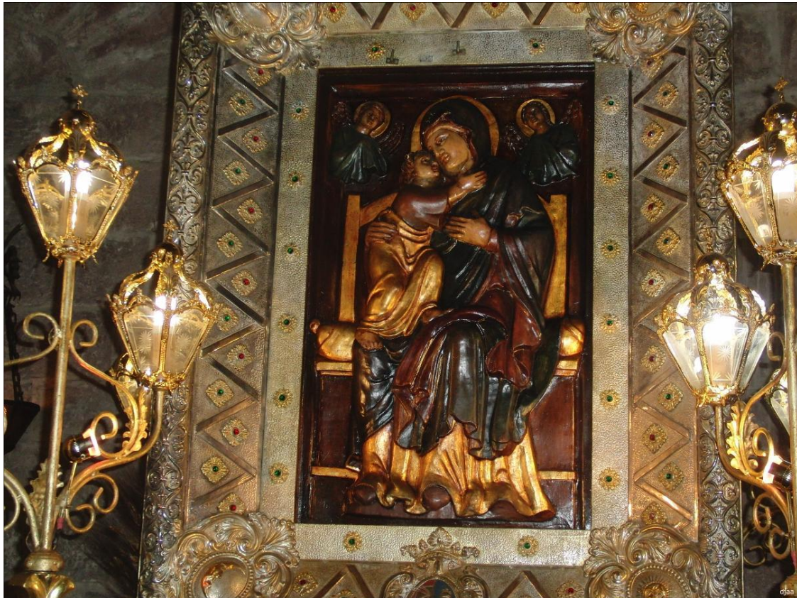
Image de la Verge d'El Puig. Monasteri d'El Puig de Santa Maria

La commemoració de la festa en l'aspecte religiós fon paralel a l'aspecte polític, donades les circumstàncies del moment. L'Ajuntament preveïa unes despeses per a costejar els festejos pero necessitava el permís del poder central. L'intervenció del Governador i del Capità General facilitaren la tramitació de les llicències pertinents.