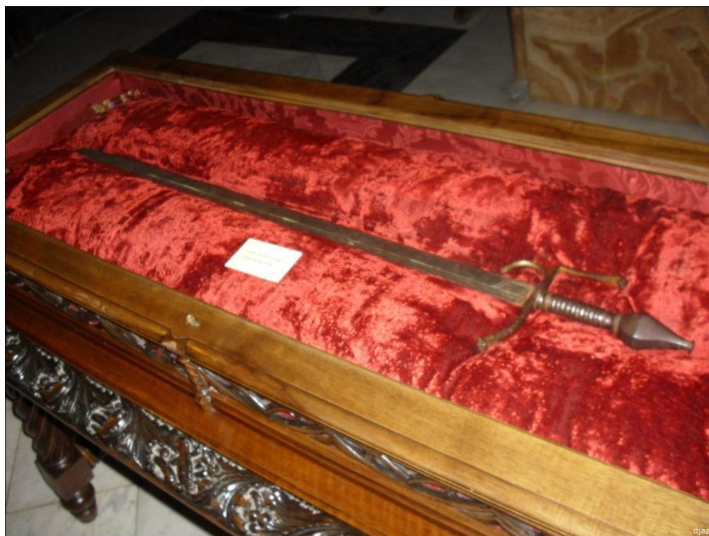
Espasa del rei En Jaume.