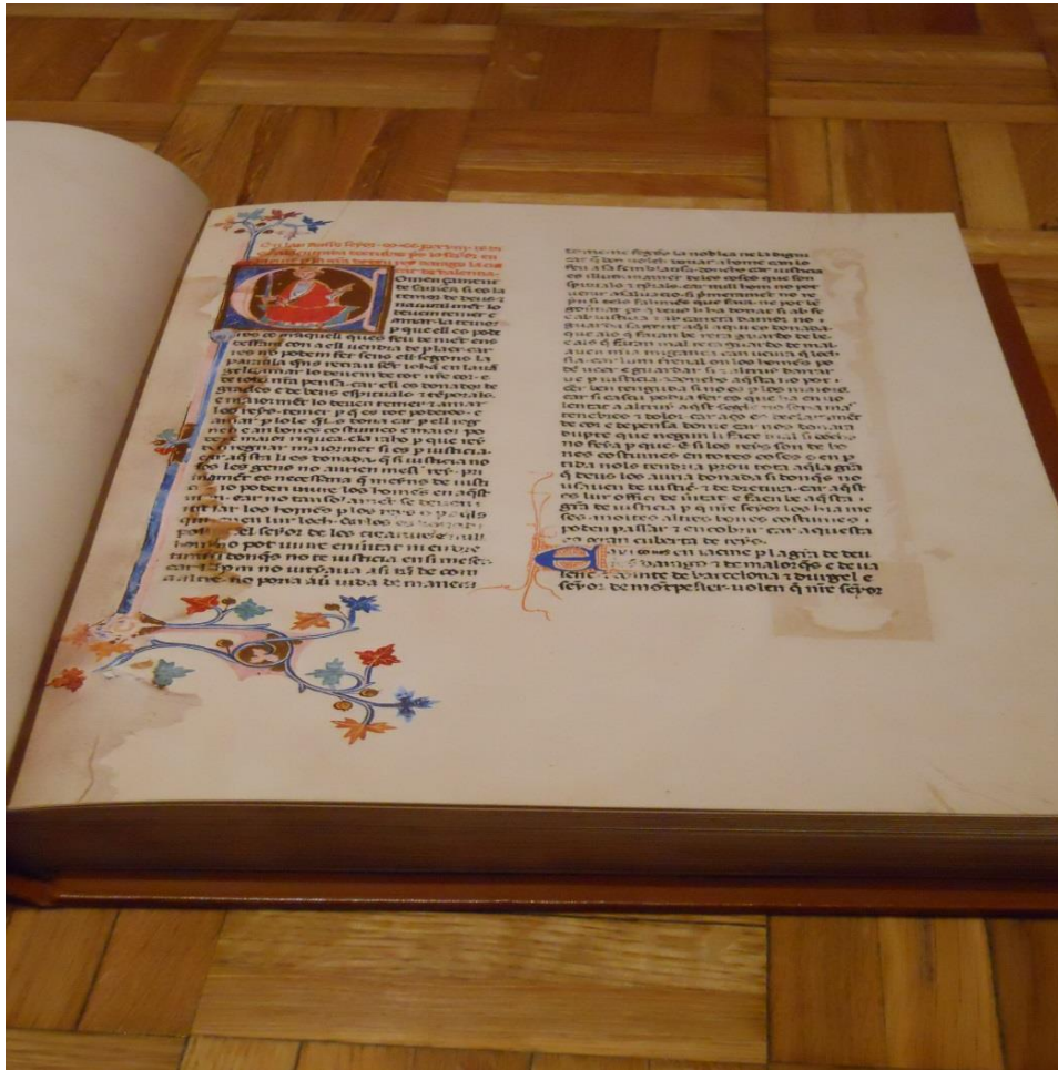
Libre dels Furs

El Libre dels Furs arplegarà el sentit de la plenitud del poder real i el criteri patrimonial del "Regnum", aixina com de l'institució de les Corts. El Monarca va erigir a la ciutat de València, una vegada capitulada, en "Cap i Casal del Regne".