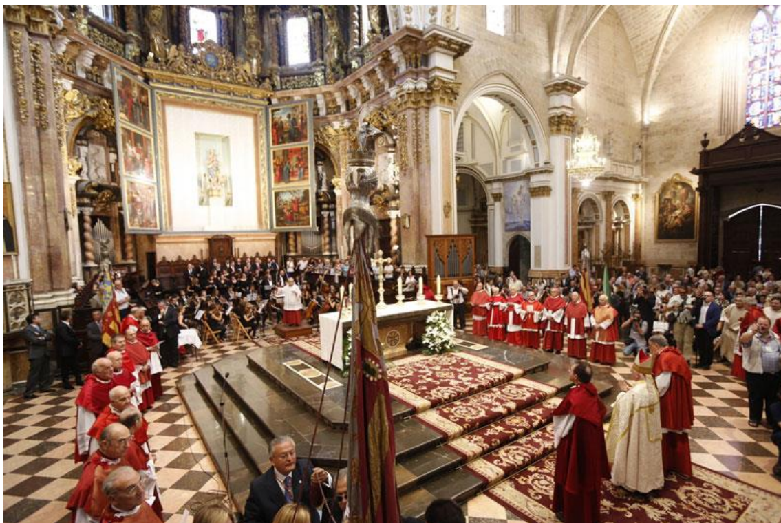
La Real Senyera en l'interior de la catedral de València el dia de Sant Donís. "Te deum"