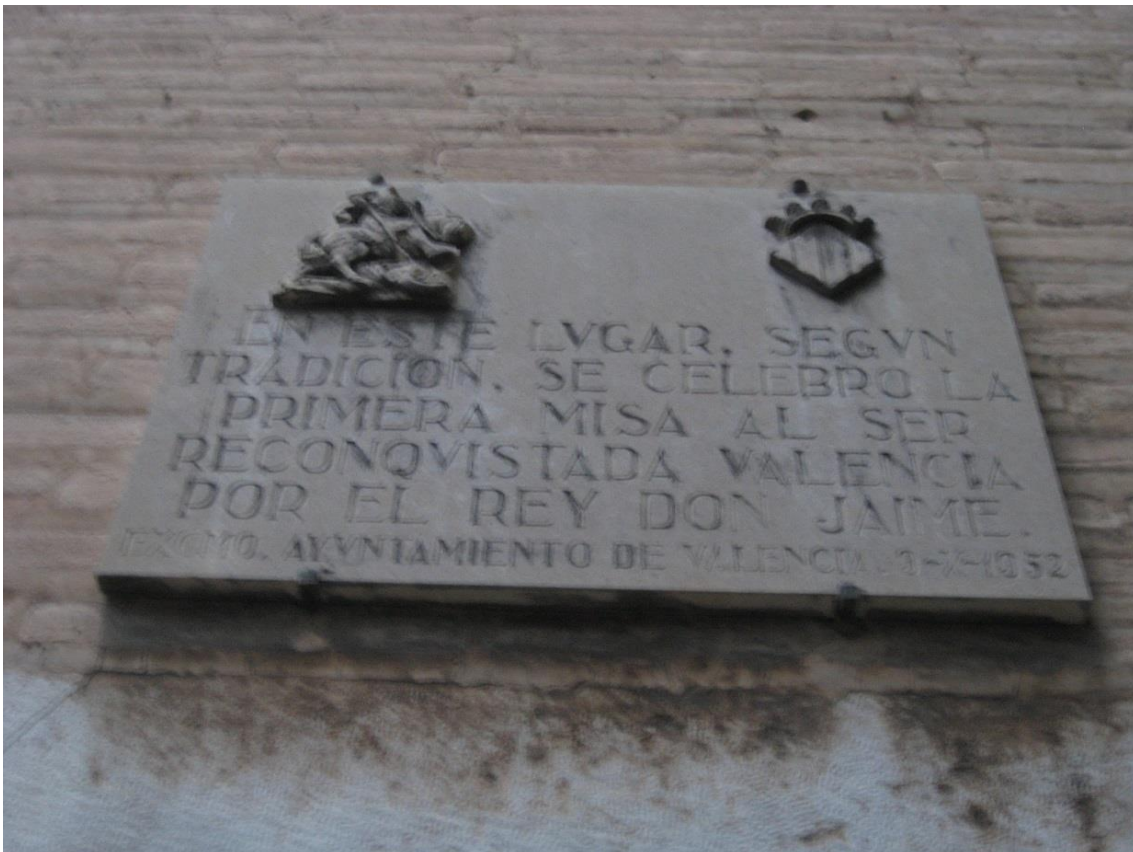
Lápida en l'exterior de l'abside de la Catedral de València

El contingut d'estes fonts, en esta qüestió, contradiu la data fixada en el Libre del Repartiment del Regne de València que afirma: “Die sabbati VII idus octobris intravimus civitatem Valentie” i del Furs del Regne de València, conservat en l'Archiu Municipal de la ciutat que registra: “En l'any de Nostre Senyor M.CC.XXX.VIII. IX dies a la entrada de octubre, pres lo senyor en Iacme, per la gracia de Deu rey d'Arago, la ciutat de Valencia” i del manuscrit llatí conservat en l'Archiu Catedralici, a on s'arplega: “Anno Domini millesimo ducentesimo XXX o . VIII o , ydus octobris cepit dominus Iacobus rex civitatem Valentie”, fixant la data de la conquesta de la ciutat el dia 15 d'octubre.