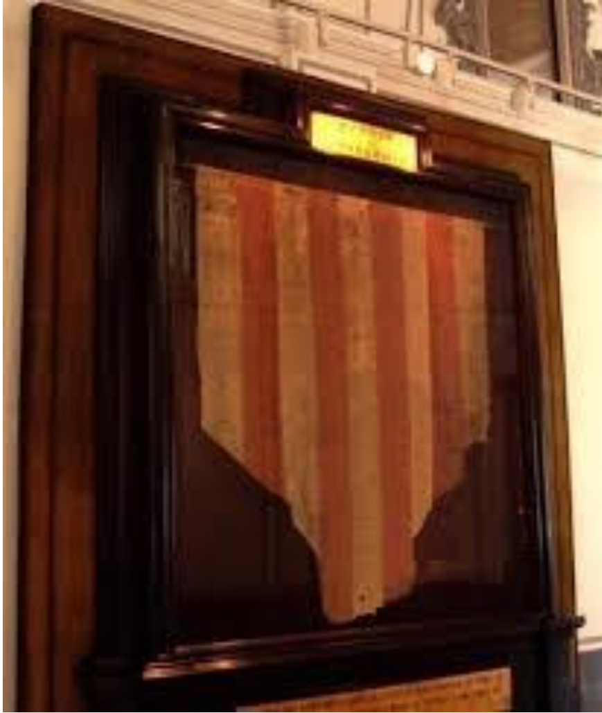
Penó de la conquesta. Archiu Municipal de l'Ajuntament de València

La commemoració d'este episodi es celebrà en una llitúrgia religiosa i un acte cívic de caràcter processional en influències d'unes atres cerimònies de l'eixercici de poder que refermava la sobirania règia.