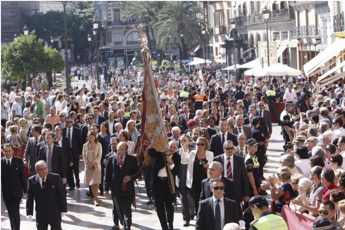
Processó cívica el 9 d'Octubre

Des de la celebració del VII Centenari fins a la dècada dels anys setanta del segle XX la festa va perdre l'aureola d'un gran acontentament històric. Els actes anaren reduint-se i l'assistència a la processó cívica fon decaent. L'arribada del sistema democràtic impulsà, de nou, la celebració del 9 d'Octubre. La promulgació de l'Estatut d'Autonomia de la Comunitat Valenciana, en 1982, va fer que les autoritats polítiques, junt en les institucions culturals que havien mantingut viu l'esperit de la celebració, Lo Rat Penat i el Centre de Cultura Valenciana, avivaren la commemoració oficial i diversos actes polítics, religiosos, culturals, i manifestacions públiques de tot signe.