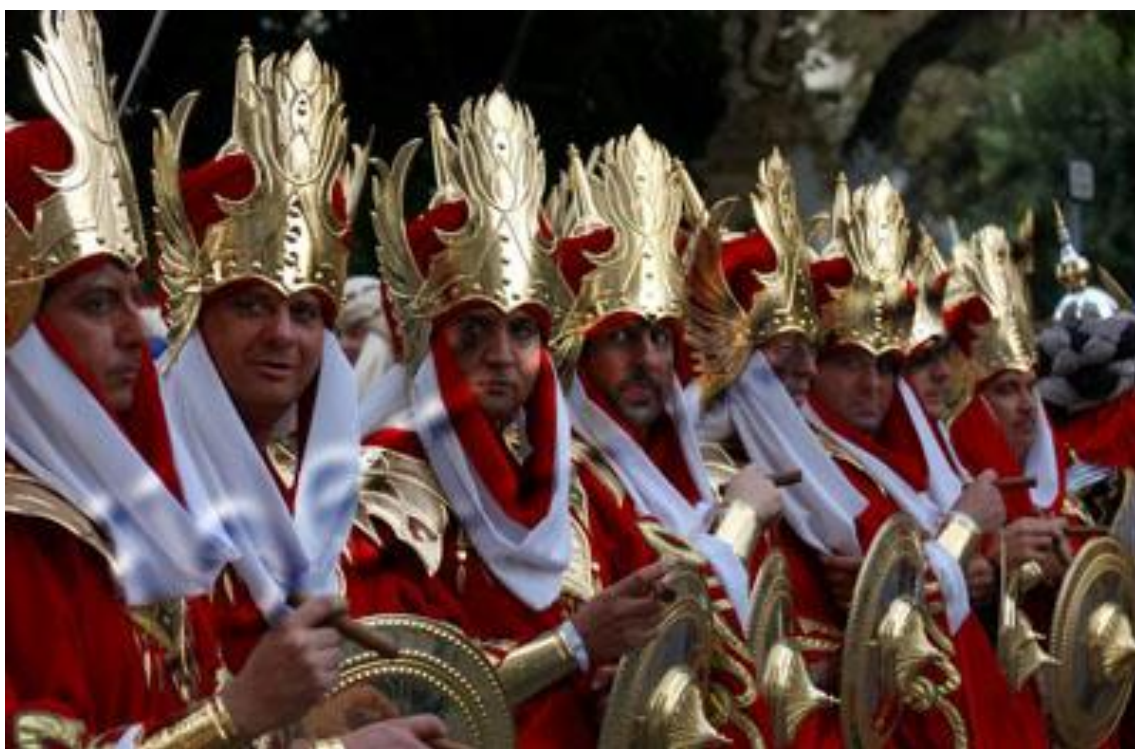
Filá de cristians. Nou d'Octubre