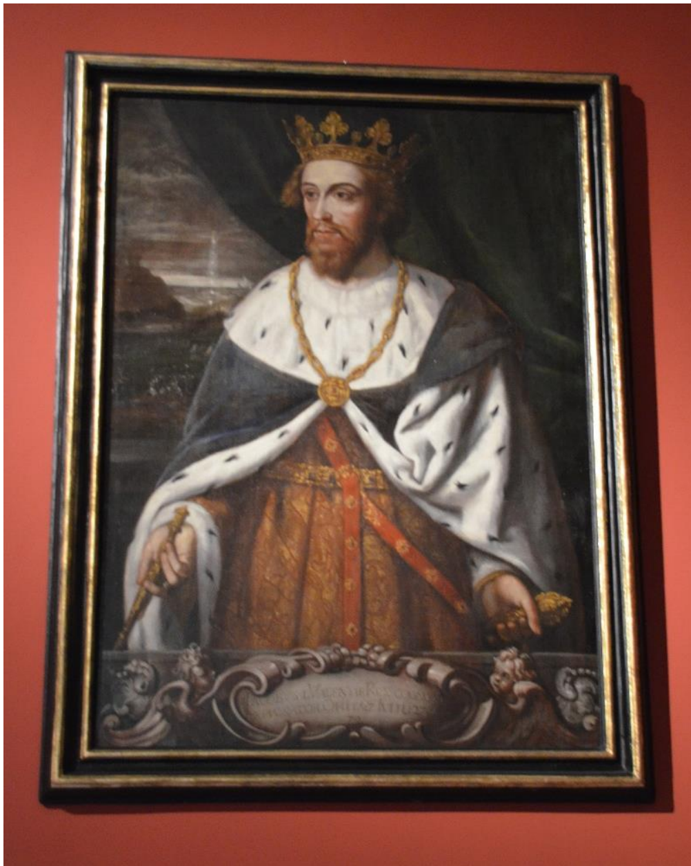
Jaume I el Conquistador o Lleislador Sala de la Capella o Saló dels Reis del Palau de la Generalitat Valenciana

ha motius per a sospitar que el rei En Jaume, conqueridor i numen del Regne de València, ho va concebre en un sentit patrimonial que no va descobrir obertament fins a l'ocupació de la capital”.