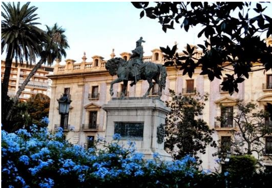
Escultura del rei En Jaume I en el Parterre

El redescobriment de la significaci  hist rico-pol tica de la celebraci  de la festa de Sant Don s tingu  lloc en 1891 quan la Societat d'Amadors de les Gl ries Valencianes, Lo Rat Penat, que organitzava anualment des de 1878 "Els Jocs Florals", va promoure la recuperaci  de l'identitat valenciana en una process  c vica en la senyera de l'instituci  cultural i visit  l'escultura eq estre de Jaume I, erigida en el Parterre, a on es colocava una corona de flors i llorer en homenage al fet hist ric de la conquesta i entrada oficial del Monarca i la seua host en la ciutat de Val ncia i la celebraci  de la primera missa oficial en la Catedral.