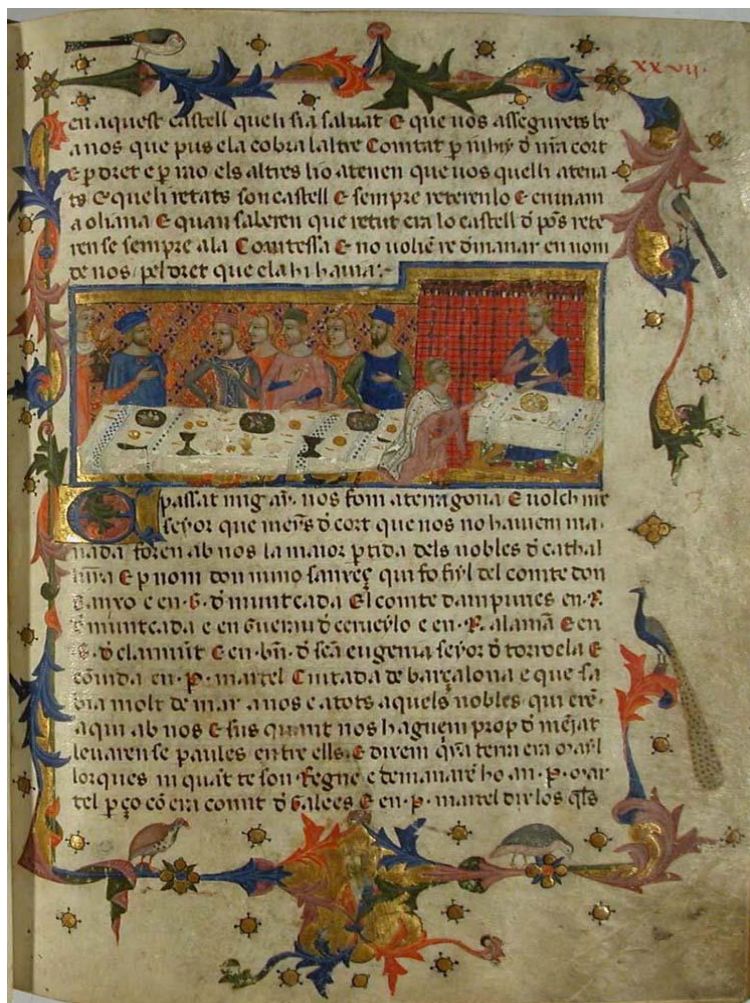
Libre dels Feys

La primera cosa que's cove a tot Rey es de guardar tots los manaments de sa lig, e que mostre al poble que ell te fermament sa lig, e que la volentat s'acord ab lo feyt” segons s'arreplega en el Libre de Saviesa 6 .