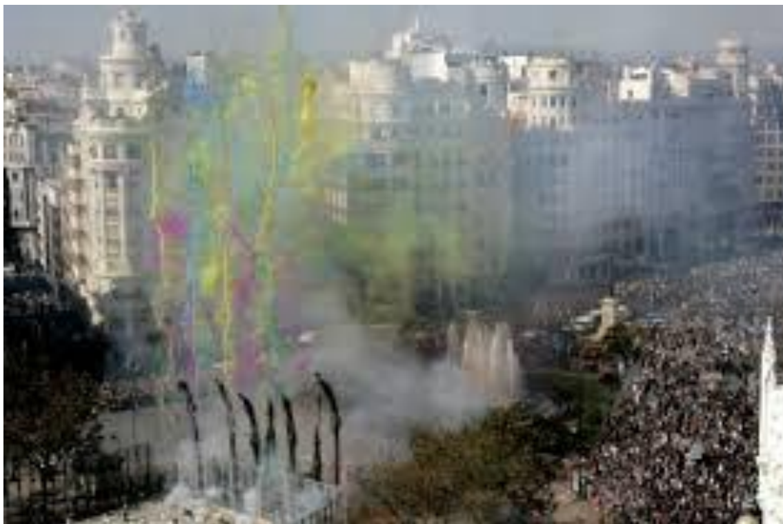
Fòcs artificials el dia de Sant Donís, Nou d'Octubre