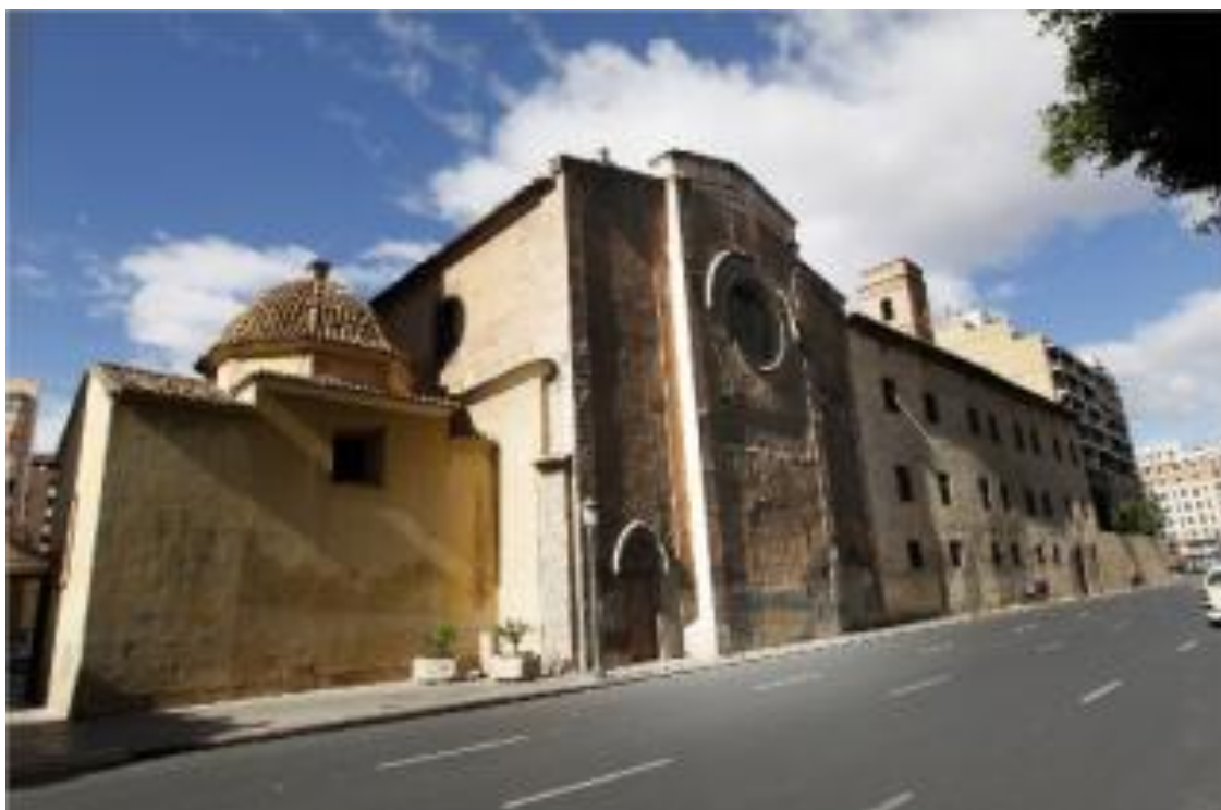
Iglésia de Sant Vicent de la Roqueta