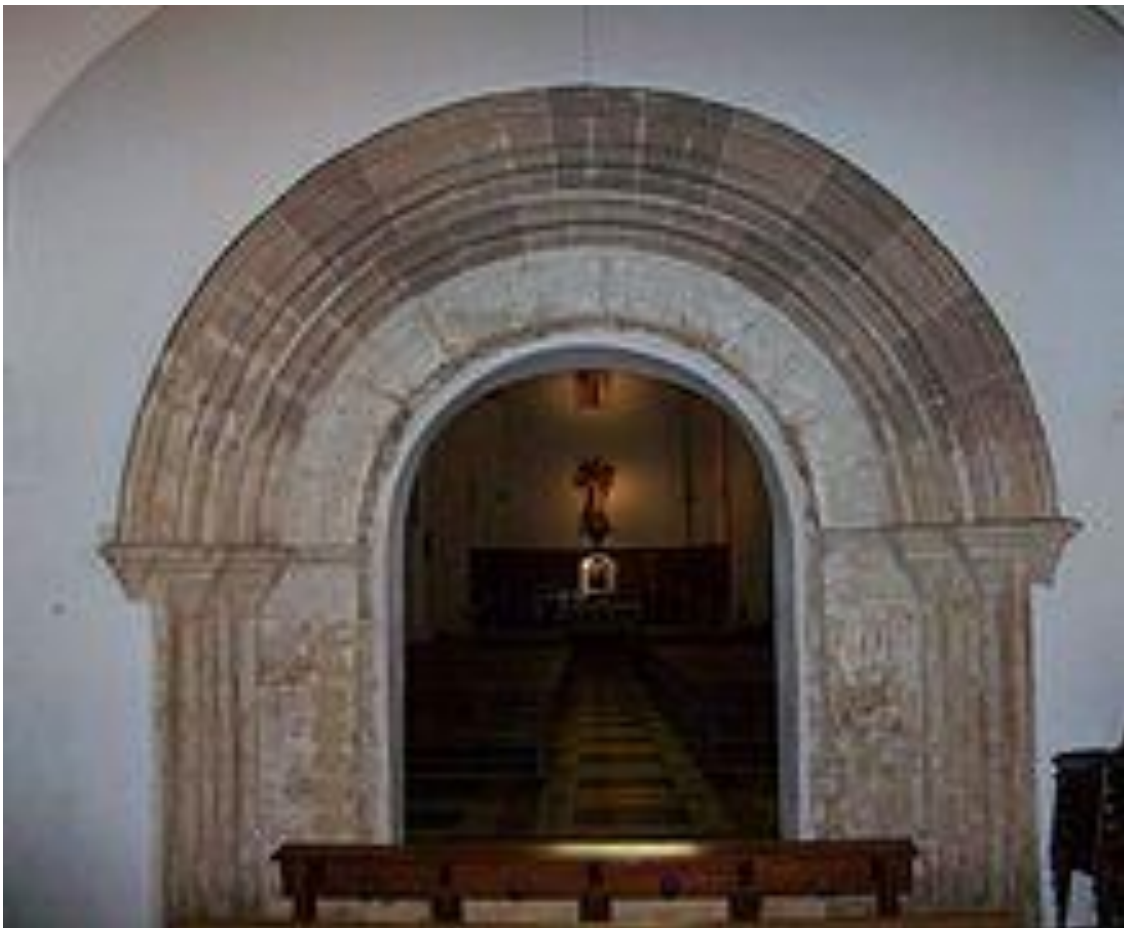
Portada tardo-romànica de l'Iglésia de Sant Vicent de la Roqueta