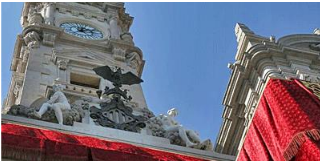
Ajuntament de València engalanat el dia de la festivitat del 9 d'Octubre

Des de l'Archiu Municipal se baixarà la senyera pel balcó principal de l'Ajuntament en la Plaça del dit nom, seguirà pels carrers següents: Sant Vicent, Plaça de la Reina, entrant en la Catedral per la Porta dels Ferros. Despuix d'entonar-se el “Te Deum”, eixirà per la porta de la Plaça de l'Almoina, carrer la Barchilla, Plaça la Reina, carrer La Pau, i se dirigirà al Parterre. Allí, davant del monument al rei En Jaume se li farà una ofrena de llorer i flors. Acabats els actes de protocol, tornarà pels carrers Pintor Sorolla i Les Barques a l'Ajuntament creuant la Plaça per la via central per a accedir pel balcó principal a la Casa Consistorial on es custodia.