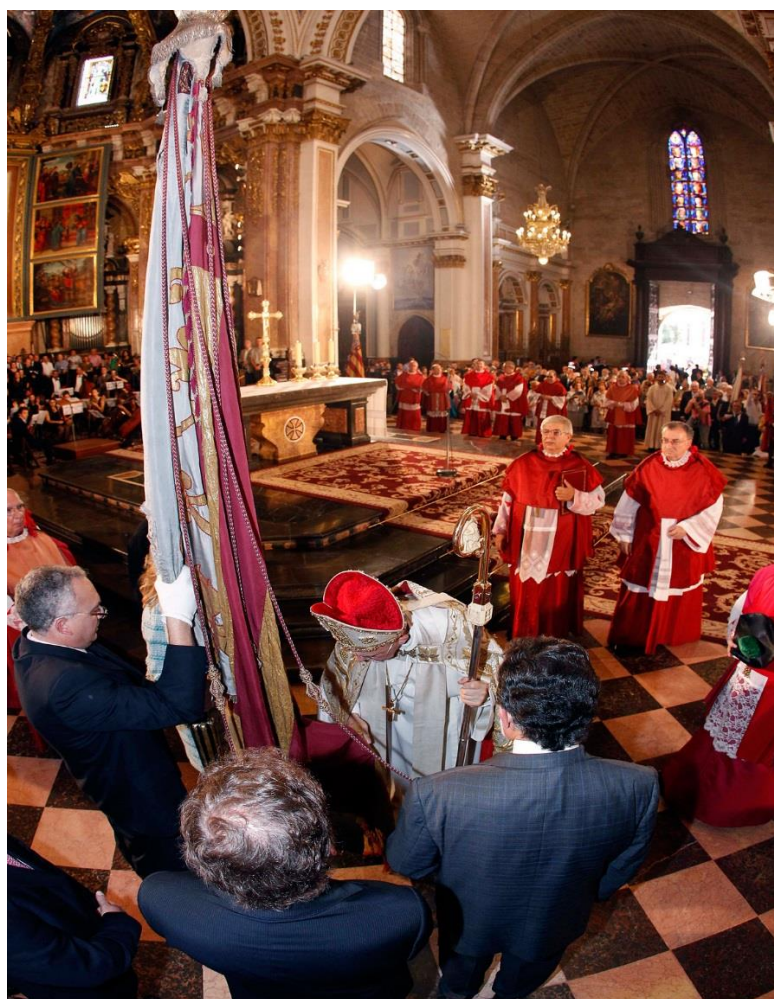
La Real Senyera dins de la catedral de València en la festivitat del Nou d'Octubre