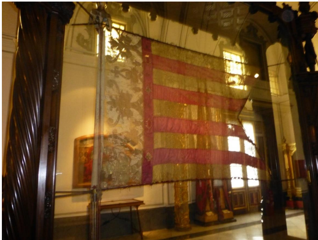
La Real Senyera.

Referent a la festa del 9 d'Octubre, dia de Sant Donís, en el “pròlec” del Doctor Gabriel Verdú diu el Sermó :